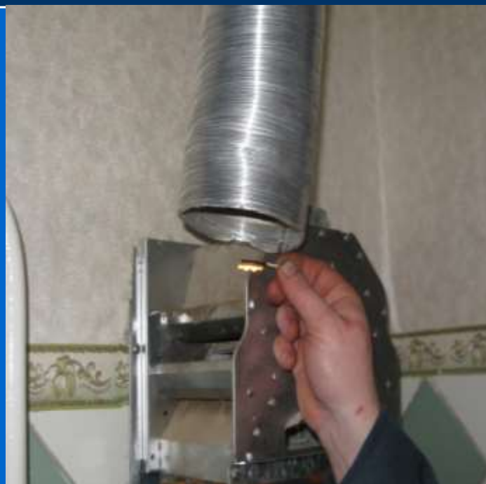
Вентилятор включен тяга обратная