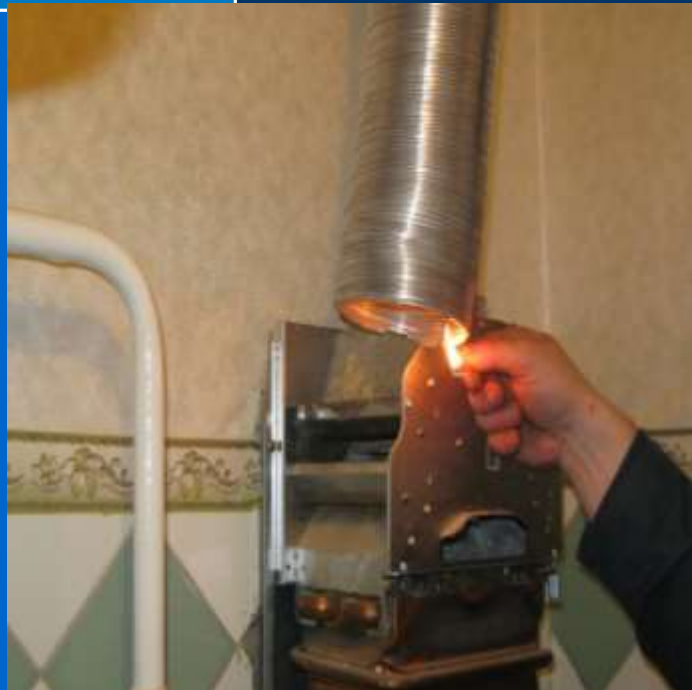
Вентилятор выключен тяга нормальная